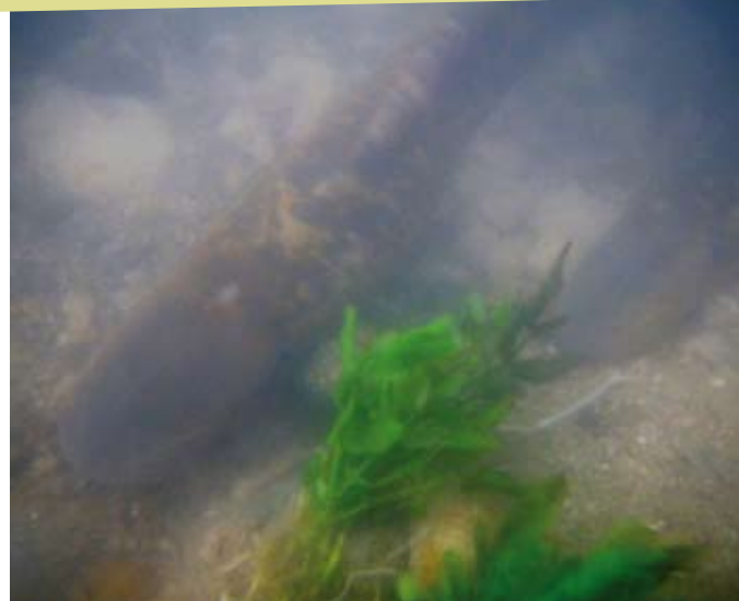
Lamproie marine dans l'Epte

Dans les sites Natura 2000 d'Île-de-France, elle est présente seulement dans le site « Vallée de l'Epte francilienne et ses affluents ».