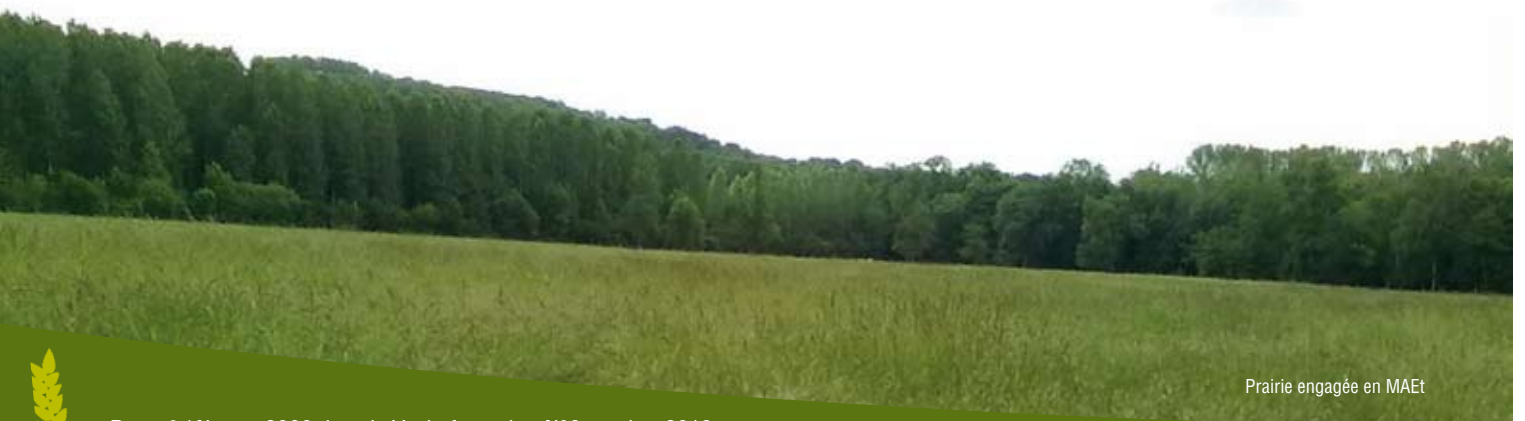
Prairie engagée en MAEt