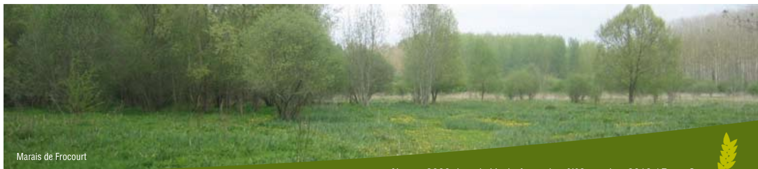
Marais de Frocourt