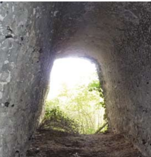
Une entrée de la cavité de Follainville-Dennemont