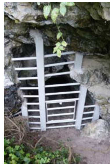
Grille à l'entrée de la cavité de Vétheuil