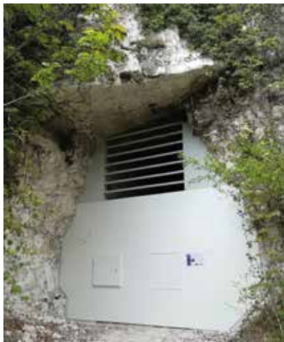
Travaux de fermeture de Follainville-Dennemont

Si vous êtes exploitant agricole, sachez qu'il est possible de mettre en œuvre des MAEC sur vos parcelles déclarées à la PAC !