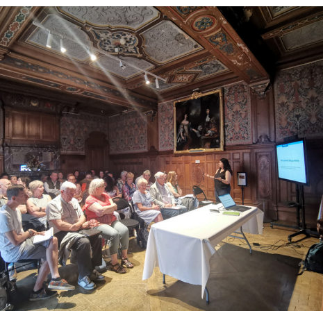
Comité de Pilotage Natura 2000 au château de La Roche-Guyon