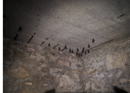
Maternité de Petits Rhinolophes découverte en 2025