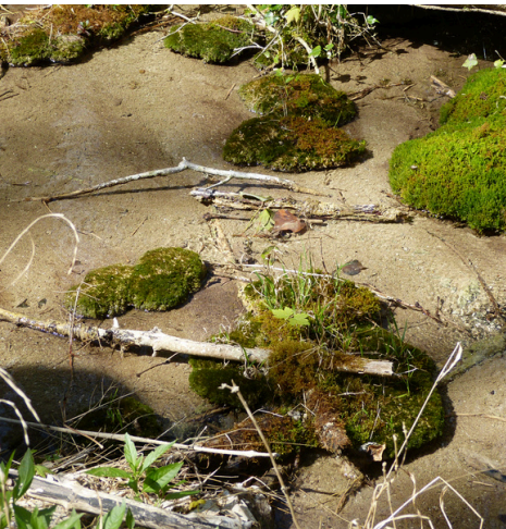
Les sources pétrifiantes, habitat de fort intérêt patrimonial